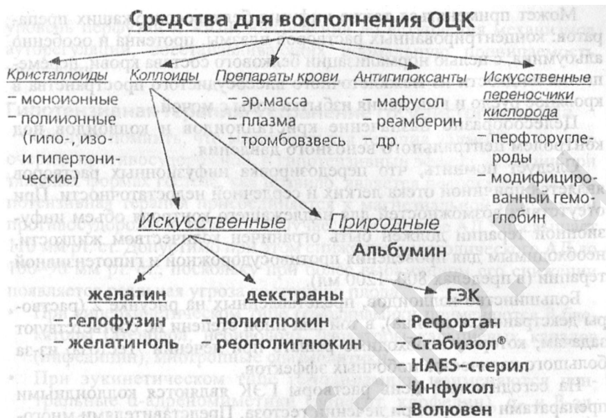
Рис. 2. Средства для восполнения ОЦК

Кристаллоиды: физиологический раствор, раствор Рингера-Локка, мафусол, ацесоль, дисоль, хлосоль, трисоль.