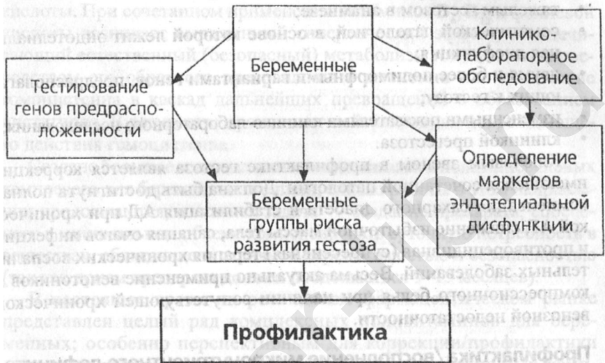
Рис. 3. Определение беременных группы риска развития гестоза