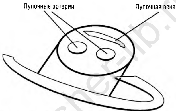
Рис. 1.1. Пупочные сосуды на срезе пуповины