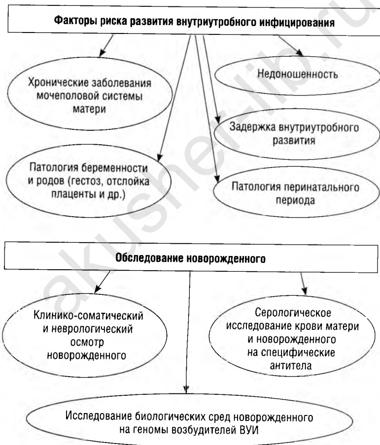
Схема 14.1. Алгоритм диагностики внутриутробной инфекции

Диагностика. Алгоритм диагностики ВУИ представлен на схеме 14.1.