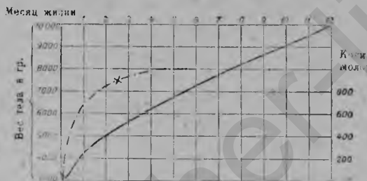
Рис. 1. Кривая веса на первом году жизни и количество выпиваемого молока в первые полгода (схема).

Прилив молока наступает у первородящей обыкновенно на 3-й или 5-й день после родов. Начиная с этого дня отделение молока непрерывно и довольно быстро усиливается, вначале даже несколько избыточно,